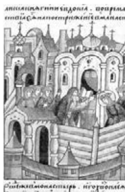
Лицевой летописный свод. Посрбие Евдокии Московской в Вознесенском монастыре Кремля