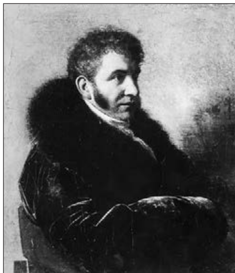
И.А. Гагарин, дед Н.Ф. Федорова. Портрет работы О.А. Кипренского. 1811

однозначные выводы о том, кто она была. Эта сторона жизни Федорова требует отдельного изучения. Особо хочу подчеркнуть, что родственные связи, пусть и с разной степенью интенсивности, поддерживались Федоровым на протяжении всей его жизни.